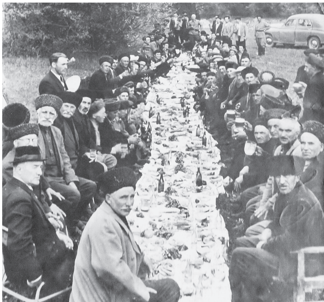
Кенженцы празднуют День Победы в нальчикском парке, 1965 год