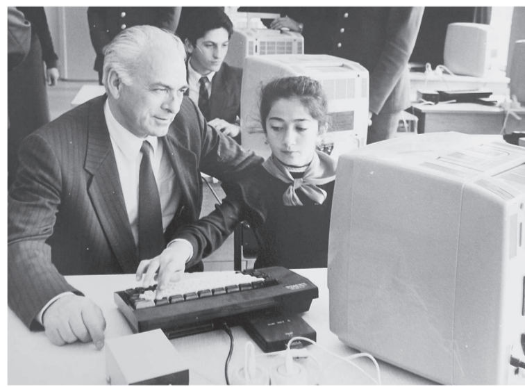
Первый компьютер в Кенже завезли как подарок ученикам школы №20 в день ее открытия в 1984 году.