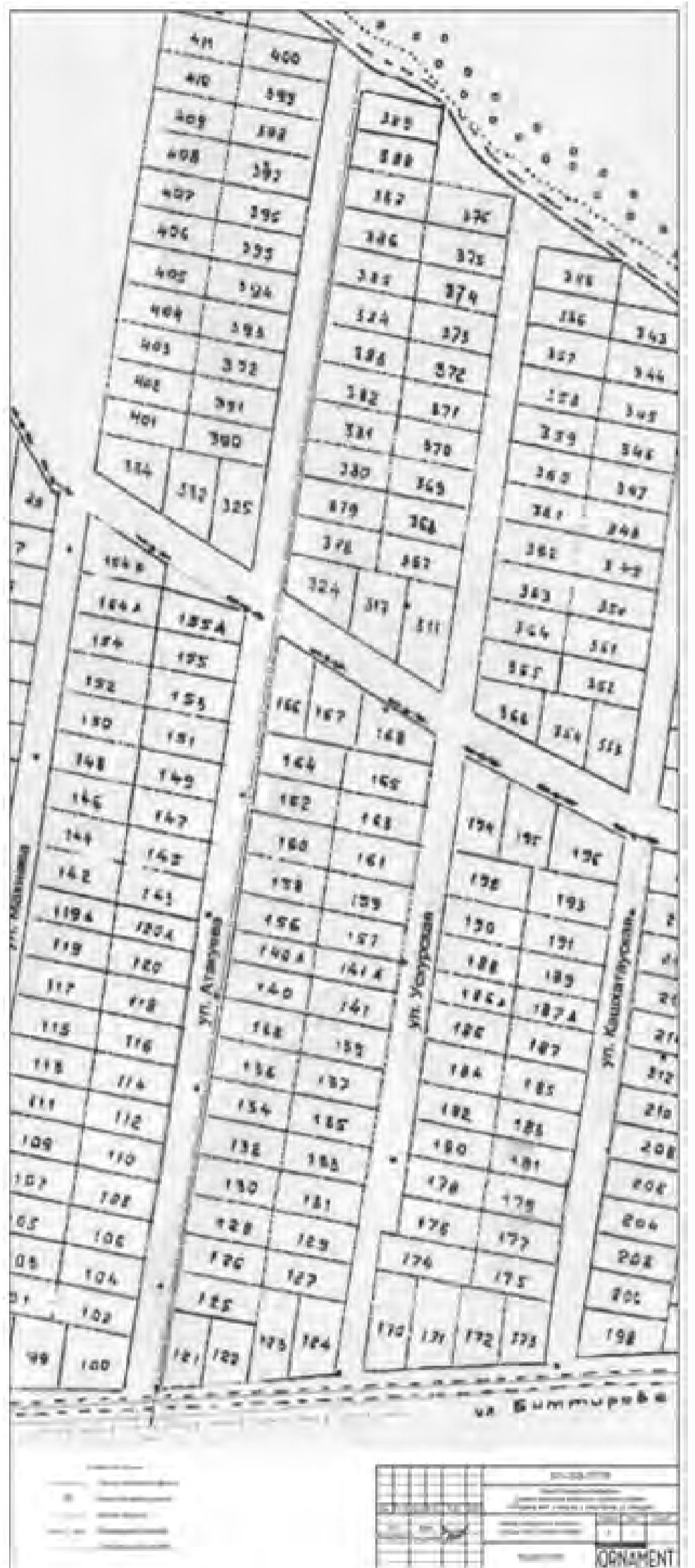
О проведении общественных обсуждений по проекту планировки и проекту межевания территории линейного объекта «Газопровод. КБР, г.о. Нальчик, с. Белая Речка, ул. Атакуева»

ПРИЛОЖЕНИЕ к постановлению Местной администрации городского округа Нальчик от 11 февраля 2020 года №187