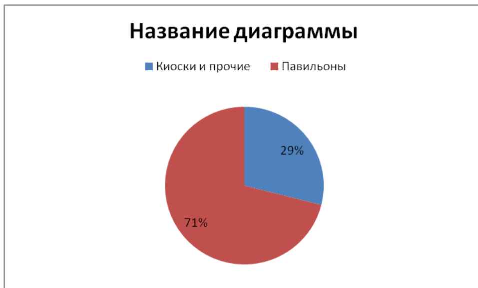
Рис. №3. Распределение общего количества объектов НТО по площади, в %.