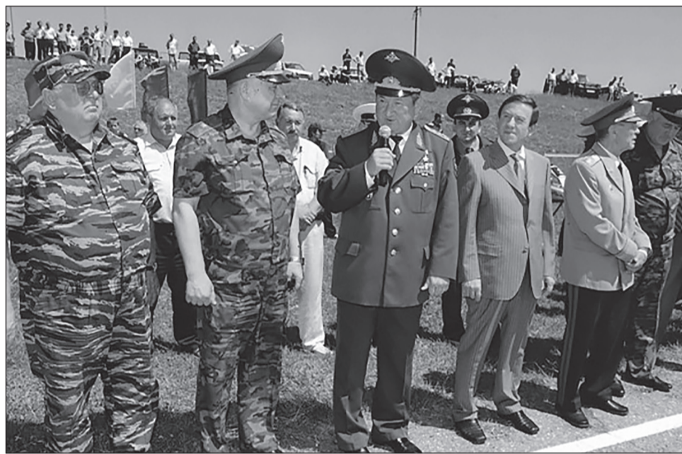
Генерал-полковник Геннадий Трошев на открытии соревнований по картингу в Чегеме-II

В 1978-м танковый полк переходит под его командование. Через год снова перевод в Тирасполь, здесь он будет командовать танковым полком до 1984 года. Затем учёба в Генеральном штабе СССР, после чего в 1988 году Геннадий Николаевич возглавил 10-ю танковую дивизию, расположенную в ГДР. Уже после распада СССР и вывода советских войск из Восточной Германии в 1992 году Геннадия Трошева направляют в Приднестровье в командировку для урегулирования вспыхнувшего межнационального конфликта. Здесь в Бендерах тогда шли настоящие длительные бои, но в результате Приднестровской республике удалось сохранить свой независимый статус.