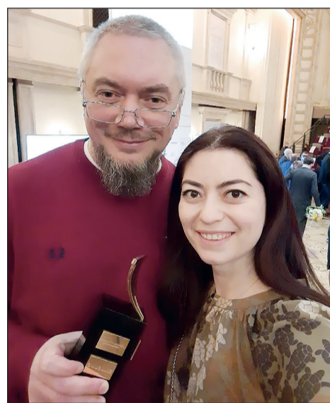
С лауреатом премии Германом Садулаевым

Номинация «Иностранная литература» относительно недавняя – она добавлена в премиальный список в 2015 году. Здесь эксперты выбирают самые важные художественные книги XXI века, написанные на иностранном языке и переведенные на русский. Длинный список этой номинации по праву считается настоящим навигатором по зарубежной литературе. Особенностью этой номинации премии «Ясная Поляна» является то, что награждается не только автор, но и переводчик. В прошлые годы лауреатами становились книги Рут Озеки, Орхана Памука, Марио Варгаса Льюсы, Амоса Оза. В этом году перед объявлением имени лауреата В.И. Толстой подчеркнул, что путь этого автора к победе был долгим – он номинируется практически каждый год, а в 2021-м в длинном списке были представлены сразу две его книги. Это блистательный британский прозаик нашего времени Джулиан Барнс и его книга «Нечего бояться» – эссеистическое