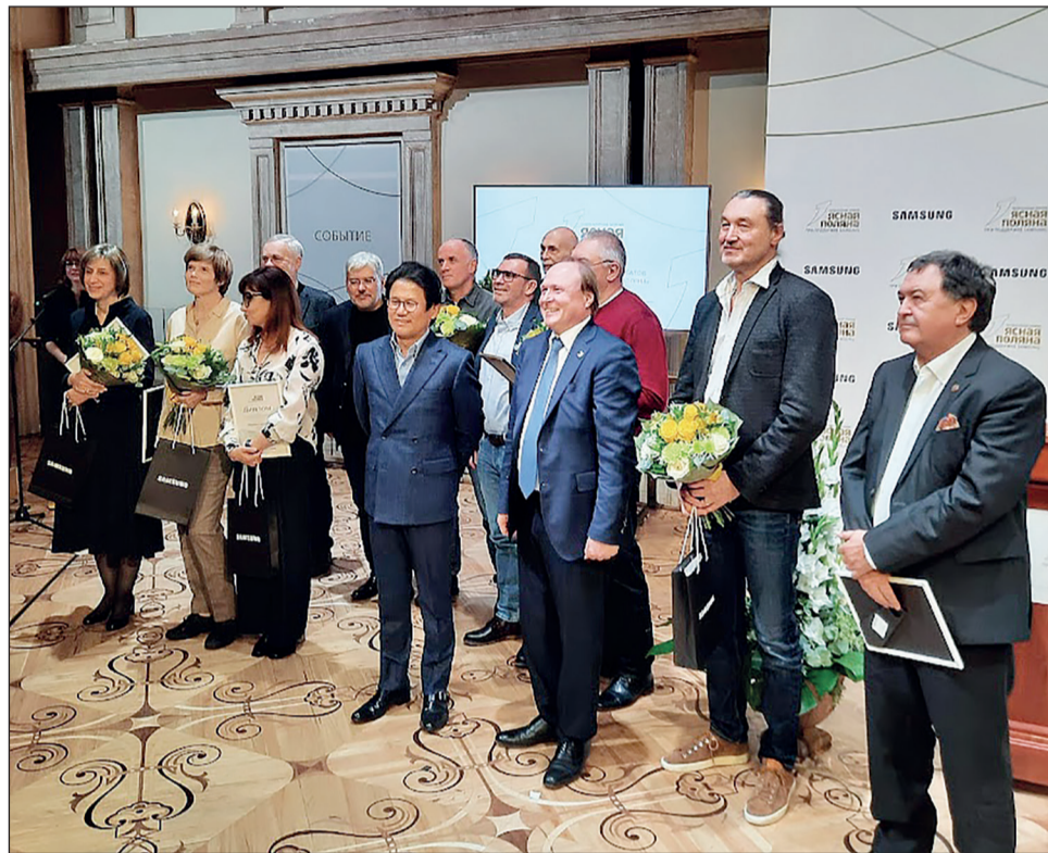
Члены жюри и номинанты премии 2021 года