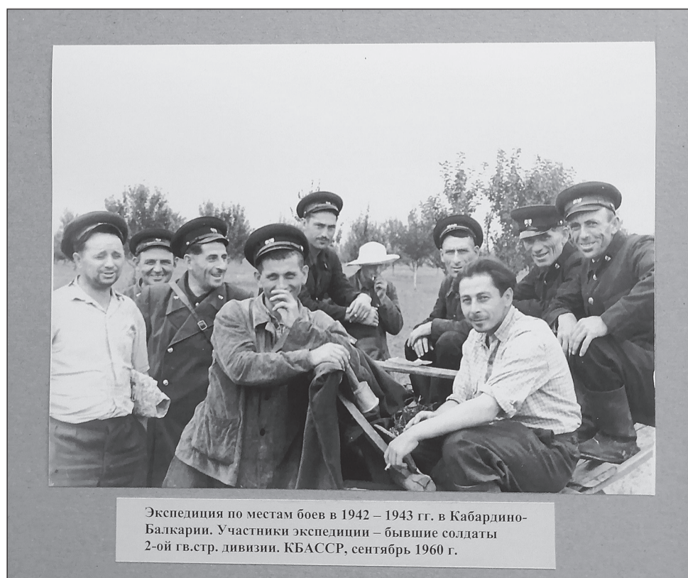
Экспедиция по местам боёв в 1942 – 1943 гг. в Кабардино-Балкарии. Участники экспедиции – бывшие солдаты 2-ой гв.стр. дивизии. КБАССР, сентябрь 1960 г.