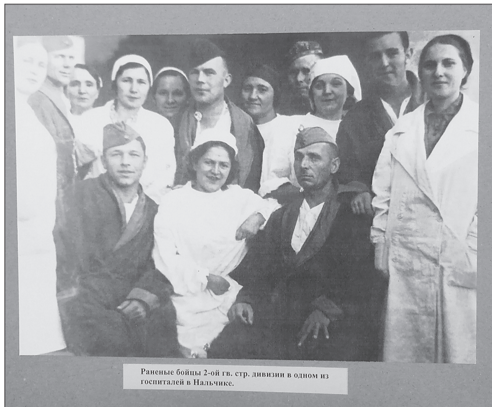
Раненые бойцы 2-ой гв. стр. дивизии в одном из госпиталей в Нальчике.