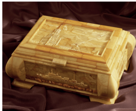
самоцвете. Выставка продлится до 25 августа.

В рамках выставочного проекта Калининградской областной музей янтаря представит в Нальчике 174 экспоната из янтаря, фотовыставку с изображением Балтийской косы фотохудожника С. Покровского и фильм о балтийском