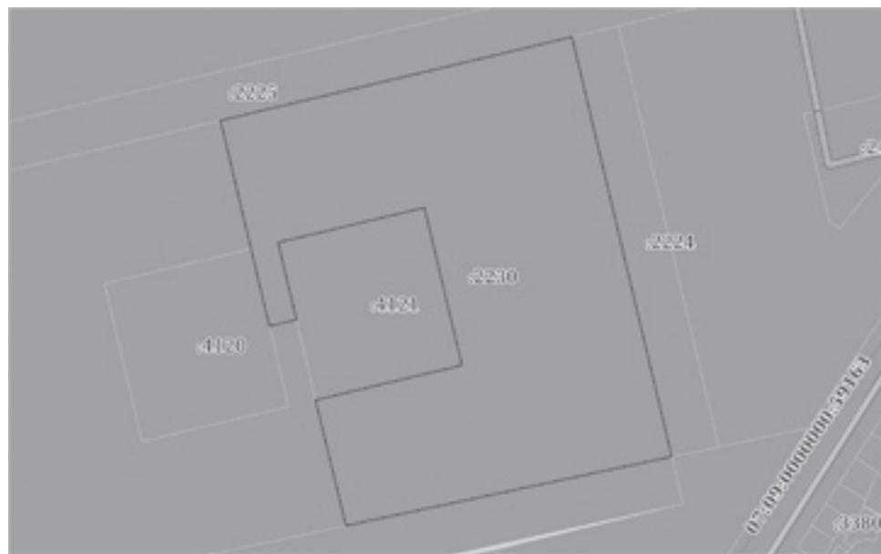
2. Сведения о характерных точках границы земельного участка