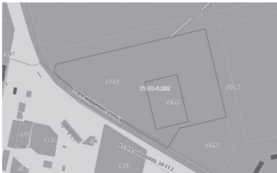
2. Сведения о характерных точках границы земельного участка