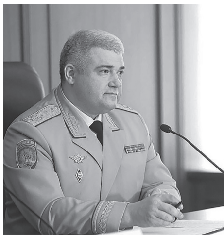
Михаил Черников, главный государственный инспектор безопасности дорожного движения Российской Федерации выступил с обращением, посвящённым Всемирному дню памяти жертв ДТП.

Дорогие друзья! Уважаемые участники дорожного движения!